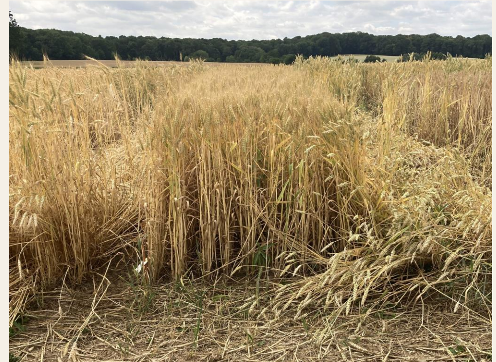
Interner Öko Versuch, Standort Bütthard 2023 Montalbano ist einer der Wenigen mit Lagerbonitur 1 vor der Ernte.