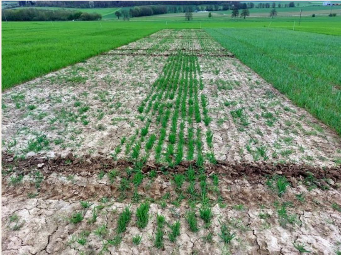
„Abb. 1: „Überlebende“ Winterhafer Parzellen am 11.04.24, am Besten präsentiert sich die Sorte Eagle.“